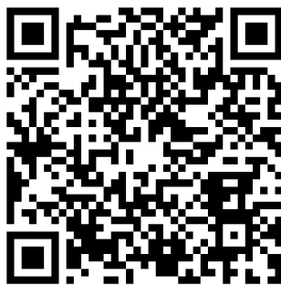
คู่มือการจัดทำทะเบียนประวัติข้าราชการ ก.พ.7 อิเล็กทรอนิกส์

1.2.1 ท่านจะได้รับ E-mail ภายใน 2-3 วันทำการ ก่อนวันมารายงานตัวเพื่อเลือกหน่วยงานที่จะบรรจุ โดยระบบ จะส่งทาง E-mail ที่ท่านได้แจ้งไว้ในใบสมัครสอบ และขอให้ท่านลงทะเบียนและบันทึกข้อมูลประวัติของท่าน ผ่านระบบ ทะเบียนประวัติอิเล็กทรอนิกส์ตามลิงค์ที่ได้รับใน E-mail หรือพิมพ์ https://seis.ocsc.go.th โดยสามารถศึกษาวิธีการ บันทึกทะเบียนประวัติ จาก “คู่มือการจัดทำทะเบียนประวัติข้าราชการ ก.พ.7 อิเล็กทรอนิกส์” ตาม QR Code ด้านล่าง