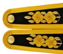
ช่อชัยพฤกษ์ มีดอก 2 ดอก

1.2.3 กรณีมีการเปลี่ยนแปลง ชื่อ - สกุล และสถานภาพ ให้นำสำเนาหลักฐานอื่น ๆ เช่น หนังสือแสดงการเปลี่ยน ชื่อ - สกุล ใบสำคัญการสมรส (ถ้ามี) อย่างละ 1 ฉบับ