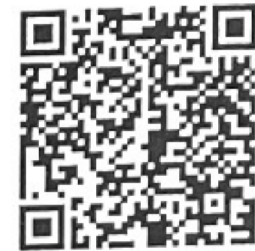
แผนปฏิบัติราชการ ระยะ 5 ปี และแผนปฏิบัติราชการประจำปี 2566