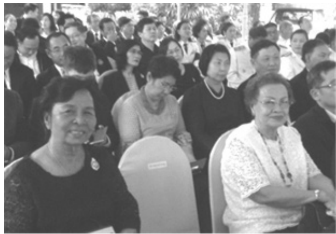
(แขกผู้มีเกียรติ)

ในการนี้ชมรมได้บริจาคเงินให้แก่ ศิริราชมูลนิธิ มหาวิทยาลัยมหิดล เป็นเงิน 8,000 บาท (แปดพันบาทถ้วน) งานสถาปนากรมส่งเสริมสหกรณ์ จัดที่บริเวณลานหน้าพระอนุสาวรีย์พระราชวรวงศ์เธอ กรมหมื่นพิทยาลงกรณ์ เริ่มด้วยพิธีสงฆ์ การอ่านสาร ของรัฐมนตรีว่าการกระทรวงเกษตรและสหกรณ์ ที่เน้นย้ำการพัฒนาไปสู่การเป็นเกษตรสมัยใหม่ที่เรียกว่า Smart Agriculture ขณะเดียวกัน ก็ให้พัฒนาบุคลากรไปสู่การเป็น Smart officer รวมทั้ง พัฒนาสหกรณ์ และกลุ่ม